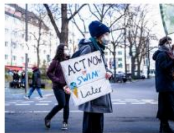
Immediate rewards or delayed gratification? A conjoint survey experiment of the public's policy preferences