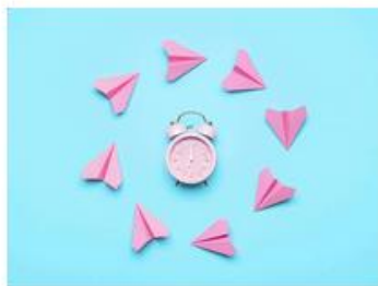
For the Sake of the Future: Can Democratic Deliberation Help Thinking and Caring about Future Generations?