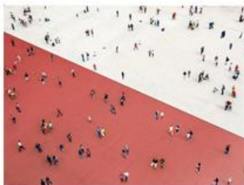
Beyond polarization and selective trust – a Citizens' Jury as a trusted source of information