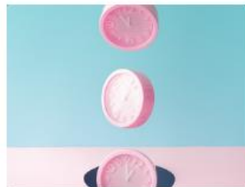
When do You Want It? Determinants of Future-Oriented Political Thinking