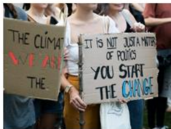
Concerned and willing to pay? Comparing policymaker and citizen attitudes towards climate change