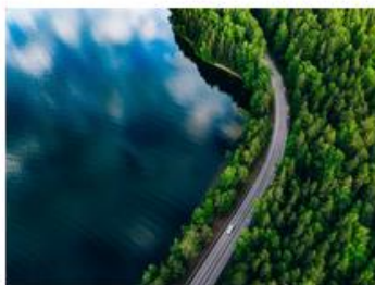
Governing through strategies: How does Finland sustain a future-oriented environmental policy for the long term?